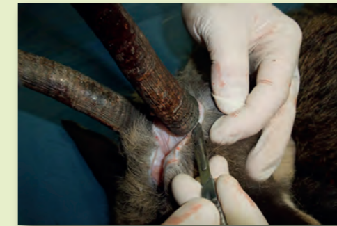
Rundumschnitt der Trophäe