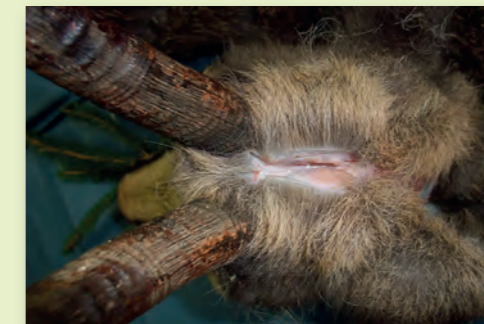
Y-Schnitt zur Trophäe